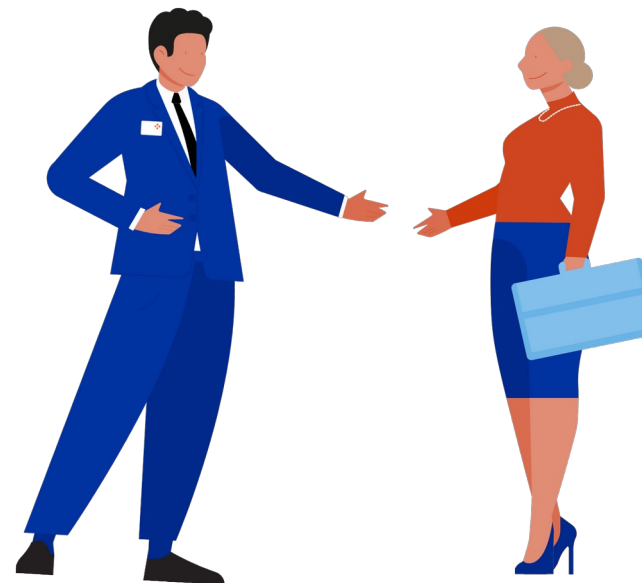
Фото Деловая фотография, нейтральный фон, без лишних деталей

Контактная информация -Телефон -Электронная почта